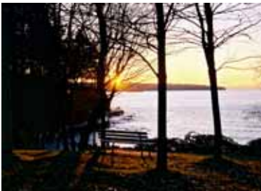
Le parc Stanley

L'écosystème très riche de la région a procuré une variété de nourriture et de matériaux qui ont permis à une importante population d'Amérindiens d'y vivre pendant plus de 10,000 ans. En 1885, Granville, rebaptisé Vancouver en 1886, fut choisie par l'entreprise de chemin de fer canadien pacifique pour être la gare terminus la plus à l'ouest.