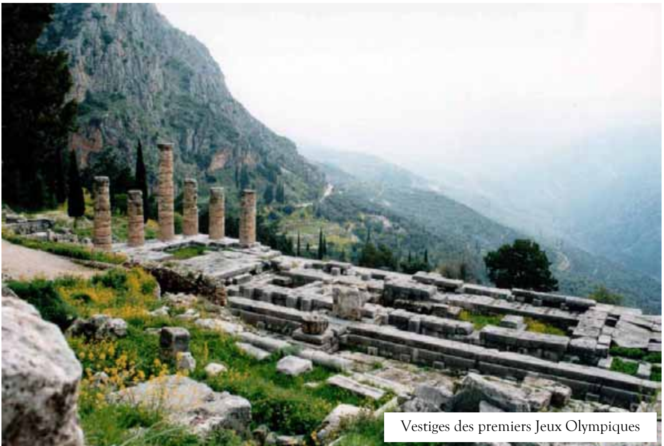
Vestiges des premiers Jeux Olympiques