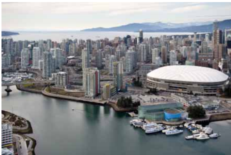
La ville de Vancouver et le site olympique.