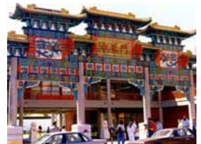
Quartier chinois de Vancouver