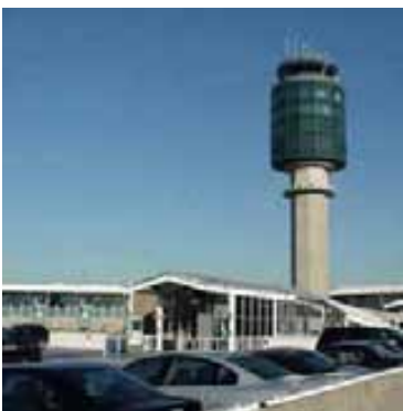
Aéroport de Vancouver

Le climat de Vancouver est très beau les mois d'été sont ensoleillés et agréablement chauds. Vancouver est au troisième rang pour le nombre d'immigrants en Amérique du Nord, il y a 37,5% d'immigrants.