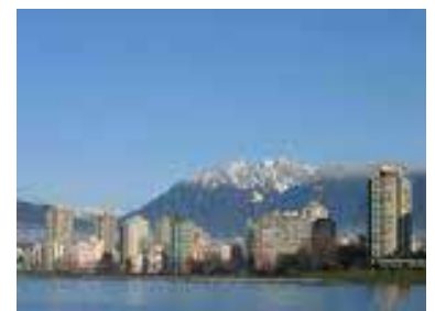
Les montagnes de Vancouver