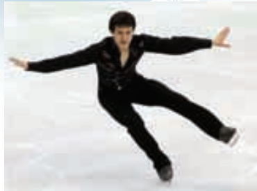
Patrick Chan patinage artistique