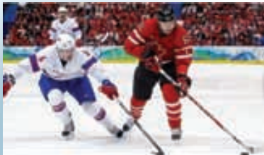
Suisse contre Canada